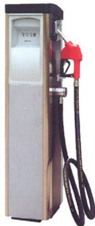
CK50D Diesel Oil Fuel Dispenser