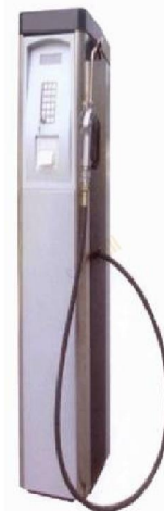
CK15L Lubricating Oil Fuel Dispenser